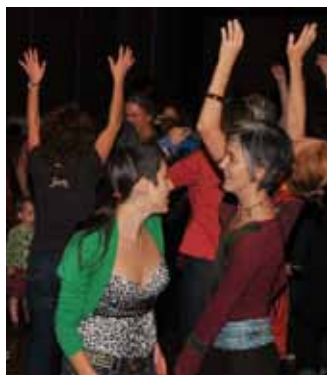
Les sages-femmes dansent en attendant la vente aux enchères en direct lors de l'évènement social.