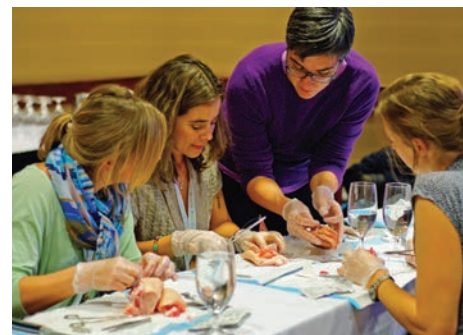
Des sages-femmes et des étudiantes participent à un atelier pratique de suture avant le début du congrès.