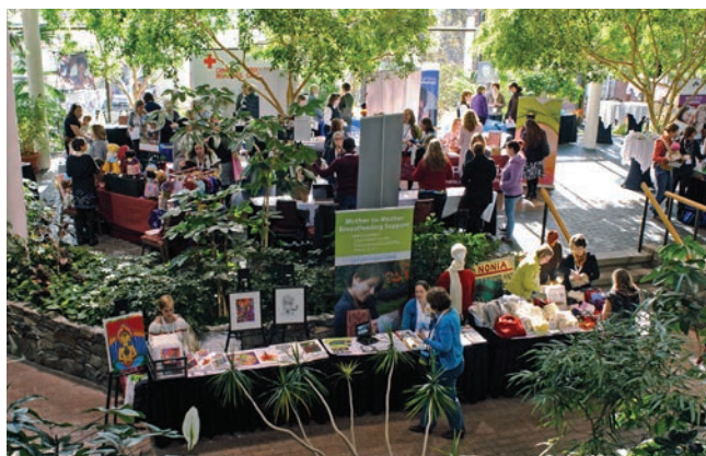
L'exposition dans l'atrium de l'hôtel.